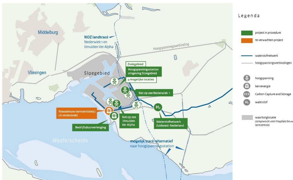
Figuur 2: Overzicht procedures energieprojecten in Zeeland