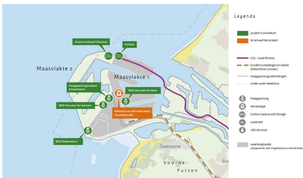
Figuur 3: Overzicht procedures energieprojecten in Zuid-Holland